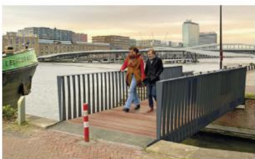
Passerelles STREETLIFE Ribbon (haut) et Twisting (bas), avec portées de 18 m de long

La chaussée de la route départementale est réduite à 5,5 m d'emprise. Le trottoir longeant les façades du bourg ancien est élargi, lui, à 1,05 m. D'un côté, les piétons sont sécurisés par le muret en pierres qui sépare la route départementale du parc du Pré de la Cure. Les bas-côtés sont végétalisés.