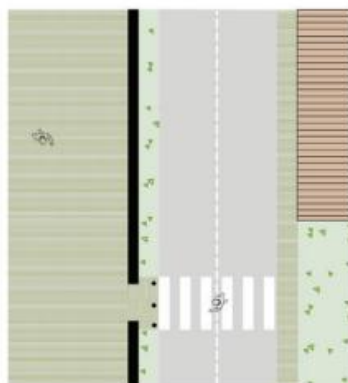
Place piétonne Accotement végétalisé Voie à double sens Chemin piéton